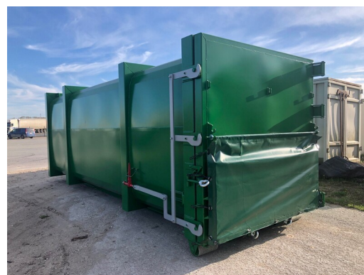
Behållare från 22 til 44m 3