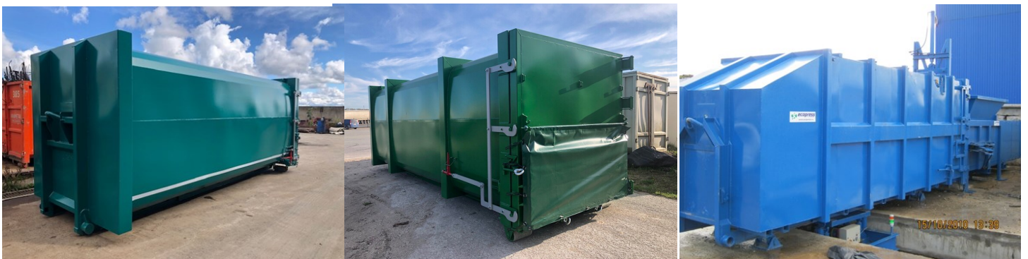
Behållare från 22 til 44m3